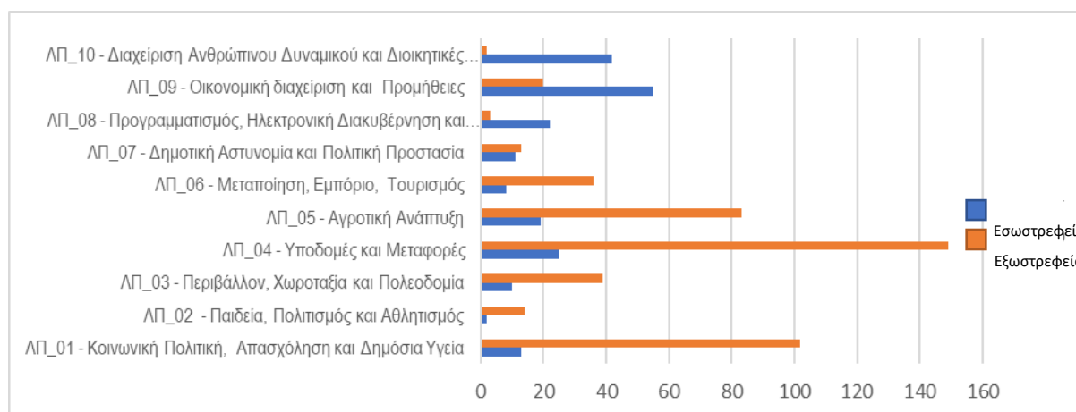
Σχήμα 2: Εξωστρεφείς και Εσωστρεφείς Διαδικασίες ανά Λειτουργική Περιοχή

Με την ολοκλήρωση των ανωτέρω, παρατίθεται η αξιολόγηση των υφιστάμενων διαδικασιών, η οποία περιλαμβάνει την αξιολόγηση των υφιστάμενων διαδικασιών και τον εντοπισμό των προβληματικών περιοχών, την κατηγοριοποίηση των διαδικασιών και τέλος, τις αρχικές προτάσεις βελτίωσης.